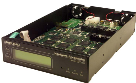
Tableau TACC1441 es un estándar industrial de-facto para el hardware de recuperación de contraseñas. Fácilmente escalables, dispositivos múltiples Tableau TACC1441 pueden ser conectados al único PC. Al ser dispositivos externos, Tableau TACC1441 son portables y pueden ser enchufados en un PC que necesita un impulso de la productividad. Consumando muy poca energía sin disipación de calor, Tableau TACC1441 es una solución respetuosa del medio ambiente que ya ha ganado la popularidad con las oficinas forenses y gubernamentales, fuerzas militares y policiales en todo el mundo.